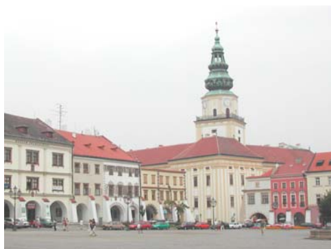
Place et château de Kromériz - 35 kms

Pour les personnes préférant la nature et le sport, notre région vous offre un grand choix. Plus de 1400 kms de routes cyclables sont balisées; de nombreux lacs à l'eau claire vous offrent des moments de baignade très agréables. Nous vous conseillons également de belles promenades équestres, des randonnées pédestres dans un parc naturel classé et la visite de grottes et de gouffres. Les nombreux lacs et rivières très poissonneux combleront les passionnés de pêche. Pour les fans de golf, nous vous recommandons le tout nouveau parcours 18 trous d'Olomouc. Et enfin pour les fans de tennis, le club mondialement connu de Prostejov (3 kms - lieu d'entraînement de Martina Hingis) est heureux de vous accueillir.