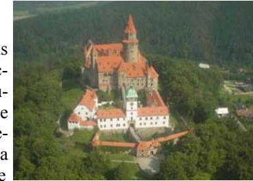
Château romanesque de Bouzov (36 kms)

Bienvenue au centre de l'Europe. Si je vous dis : Bohême, Moravie ou encore Silésie, à quoi pensez-vous ? Ces trois régions mythiques forment notre merveilleux pays : la République Tchèque.