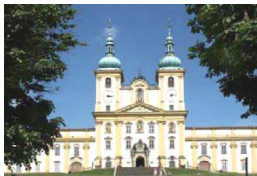
Basilique de Svaty-Kopecek (Olomouc) - 20 kms

La Moravie Centrale offre un large éventail culturel sur un territoire relativement petit. Chaque ville a sa propre couleur locale, qui ne reflète pas seulement la vie d'aujourd'hui, mais aussi son très riche passé qui remonte au tout début du Moyen Age. Il existe de magnifiques