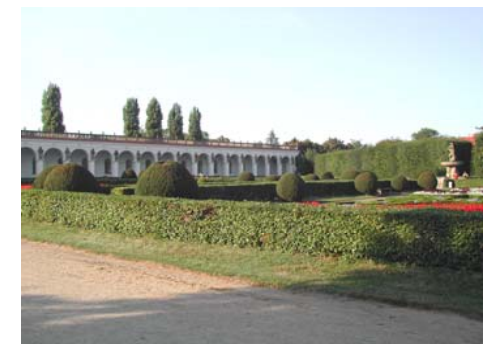
Jardin de Kroméřiz classé au patrimoine mondial de l'UNESCO 35 kms