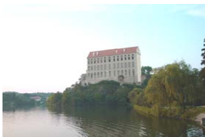
Château de Plumlov - 8 kms

Notre région est très riche en châteaux et châteaux forts. Nous n'en citerons que quelques uns car la liste est longue. Le château archiépiscopal de Kromériz (16 ème s.) classé au patrimoine mondial de l'UNESCO dont on a conservé l'intérieur unique au monde ainsi qu'une des plus prestigieuses collections de peintures européennes du 15 ème au 18 ème siècle (Véronèse, Tintin, Van Dyck, Lucas Cranach la Vieux). Ainsi que les châteaux de Cechy pod Kosirem datant du 18 ème s. (à 7 kms), de Tovacov du 14 ème s. (à 20 kms), de Prostejov du 15 ème s. (à 4 kms) ou encore de Plumlov du 17 ème s. (à 8 kms). Concernant les châteaux forts, il sont nombreux. Nous citons Helfstyn du 14 ème s. (à 35 kms), Bouzov du 13 ème s. (à 36 kms) ou encore Sternberk 13 ème s. (à 40 kms). Avec un passé si riche, la région compte de nombreux musées.