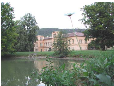
Château de Cechy-pod-Kosirem - 7 kms