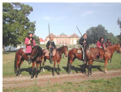
Cavaliers devant le château de Slavkov (Austerlitz) lors de la reconstitution d'été - 50 kms

Toutes ces activités vous offrent un grand choix pour vous organiser un séjour des plus agréables dans notre magnifique région. Tout au long de vos promenades, vous découvrirez l'artisanat Tchèque (cristal de Bohême, travail du bois ...).